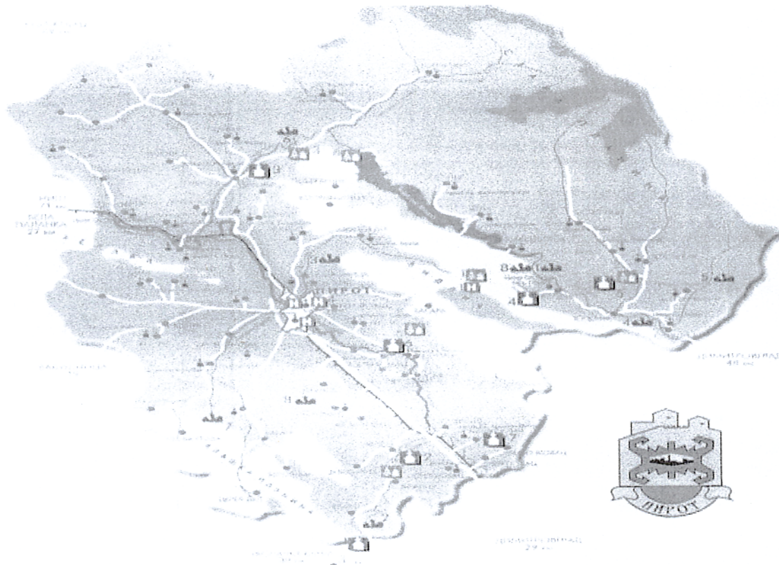
Карта Општине Пирот

На северним и североисточним деловима града почињу падине Старе планине (Маркова штрапка, Мунтина падина, Наљин трап, Каменита рудина, Црни врх – 1152м нв и Басара). Јужно од града се простире Пиротско поље које прелази у падине Влашких планина и Суве планине (Божурато, Беровска рудина и Козарица).